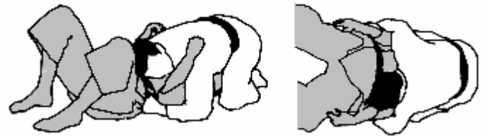
Kami shiho-gatame (Langs boven op vier punten houden)