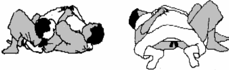
Yoko shiho-gatame (Zijwaarts op vier punten houden)